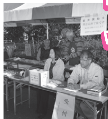
毎年大人気!! シルバー人材センターさんによる、無料包丁研ぎコーナーが今年も参加してくださいませよー!

また、当日は「ふれあい消防広場」も同時開催され、体験・展示コーナー・模擬店が開かれます。当日は、多くの皆さんの来場をお待ちしております。